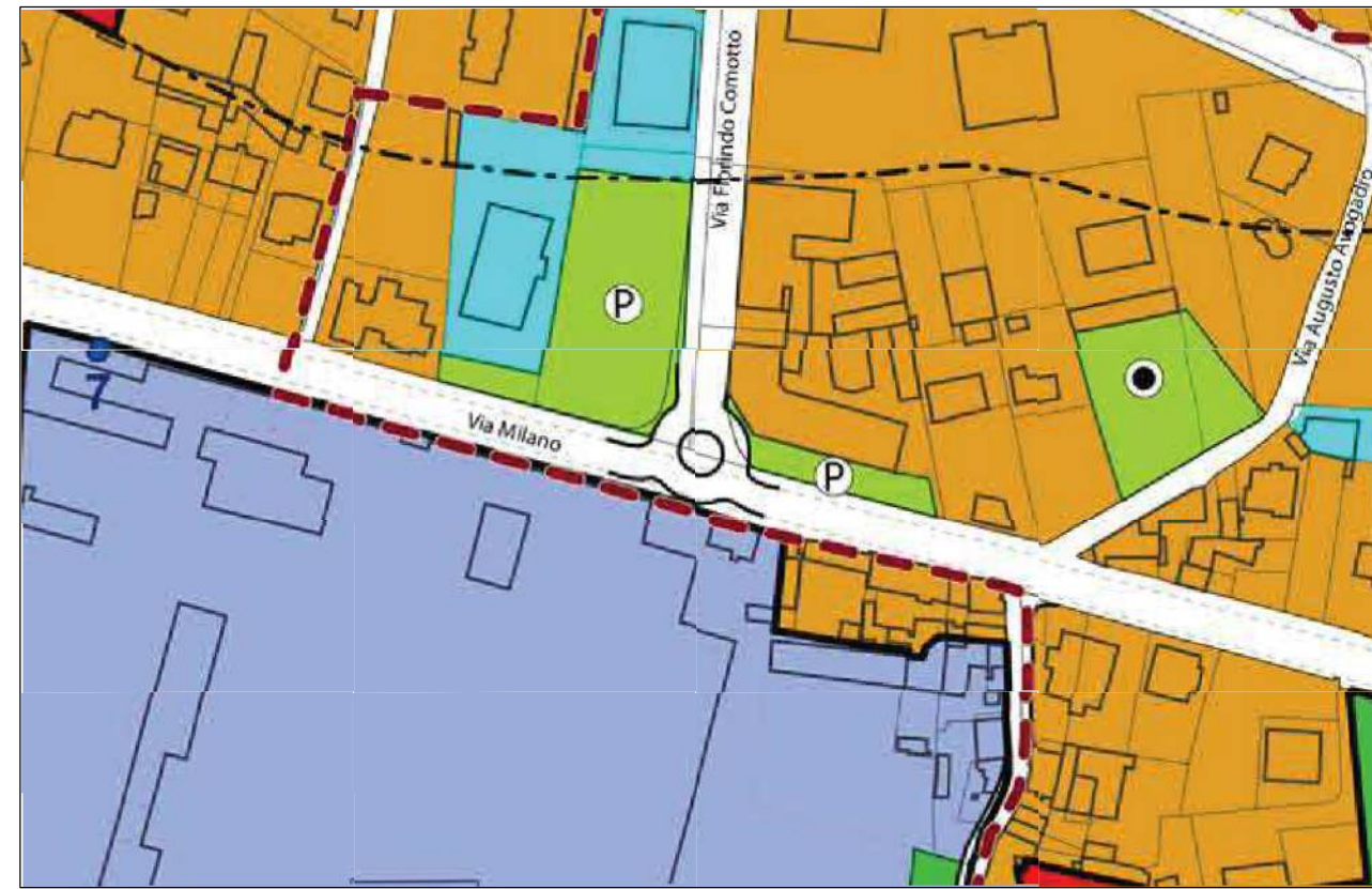
ESTRATTO DI P.R.G.C. scala 1:2000 Comune di Vigliano Bielese, usi del suolo